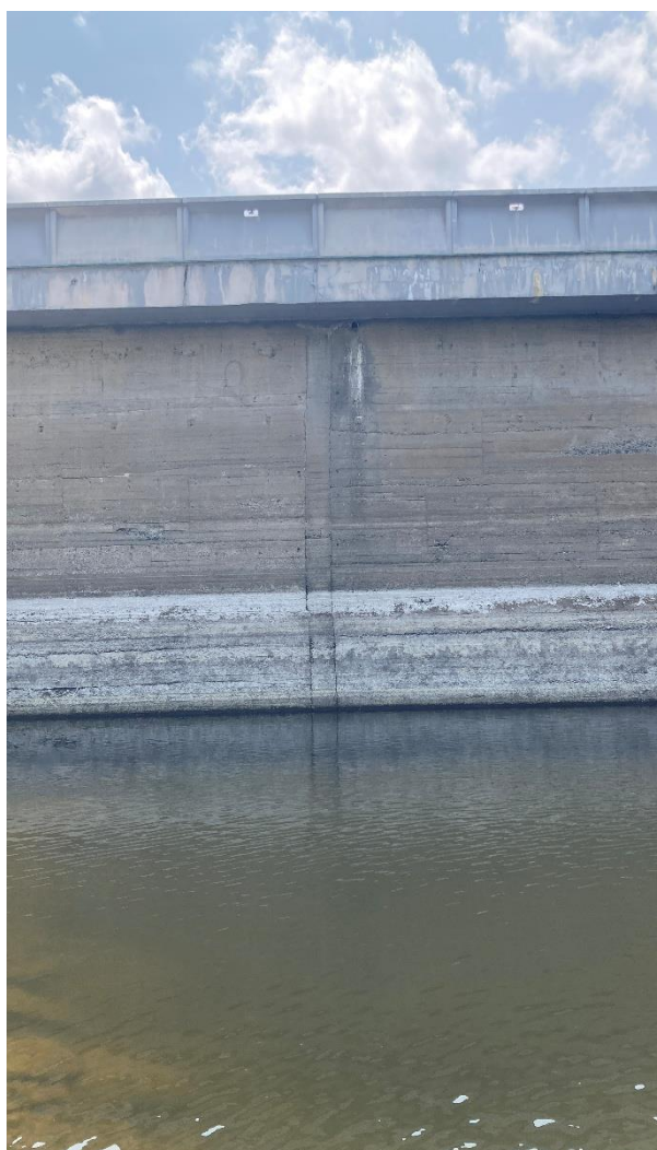
Obrázek 9: Dilatační spára na návodní straně hráze.