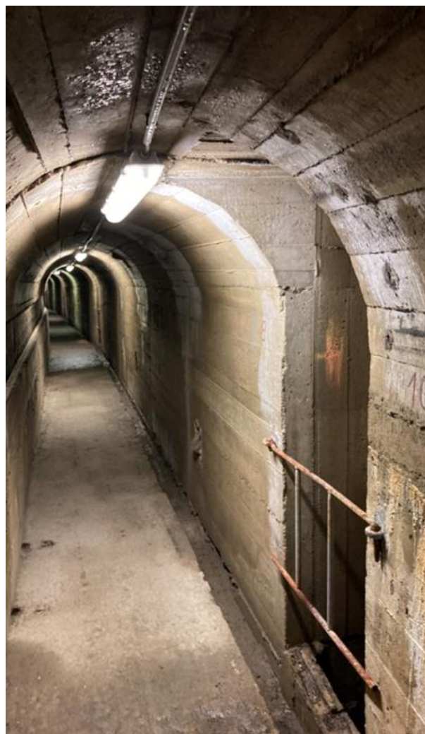
Obrázek 3: Štola s kontrolní šachtou.