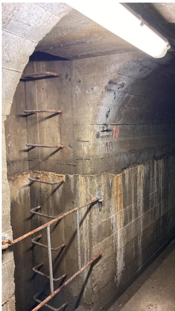
Obrázek 4: Kontrolní šachta.