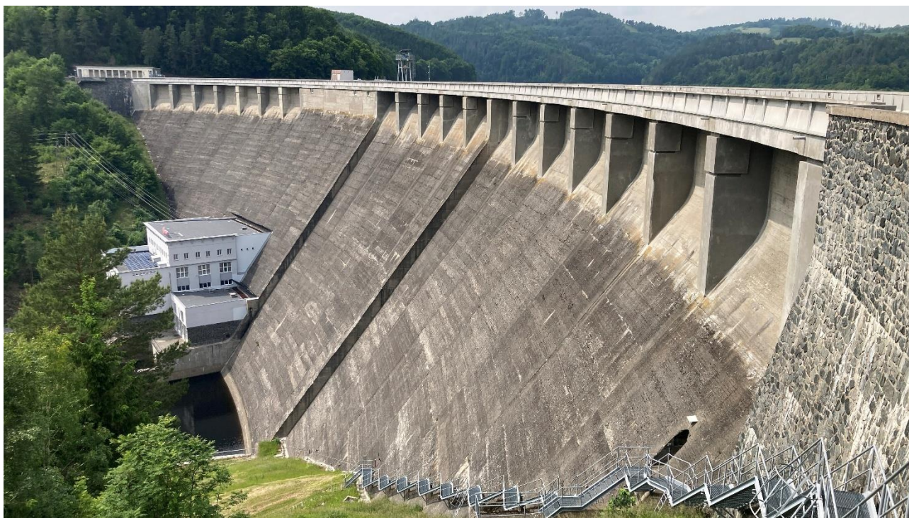
Obrázek 1: VD Vír I, vzdušný svah.