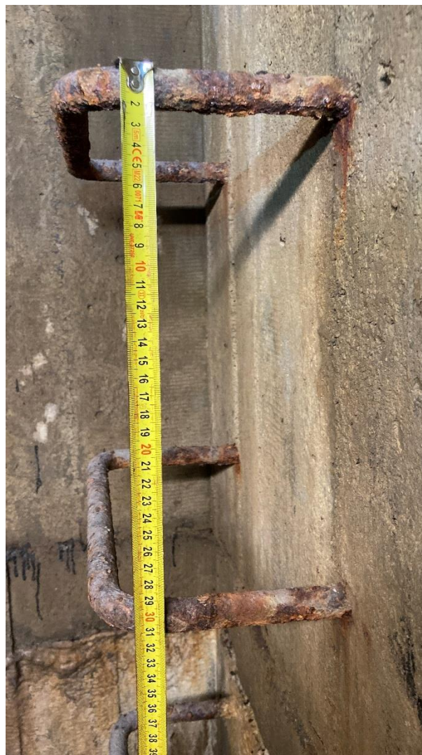
Obrázek 5: Detail stupadel.