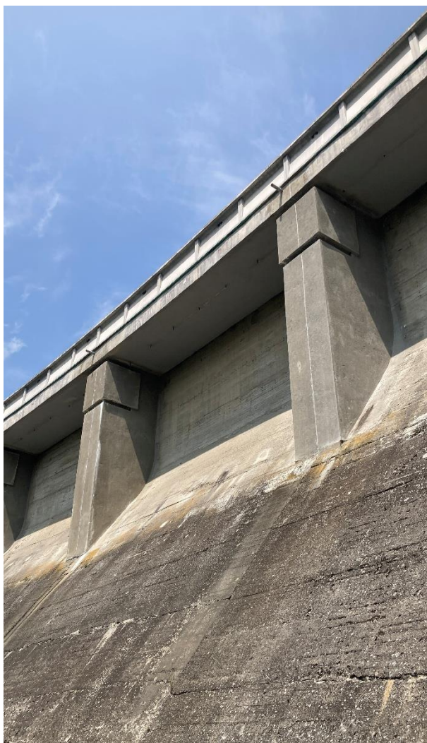
Obrázek 8: Dilatační spára na vzdušné straně hráze.