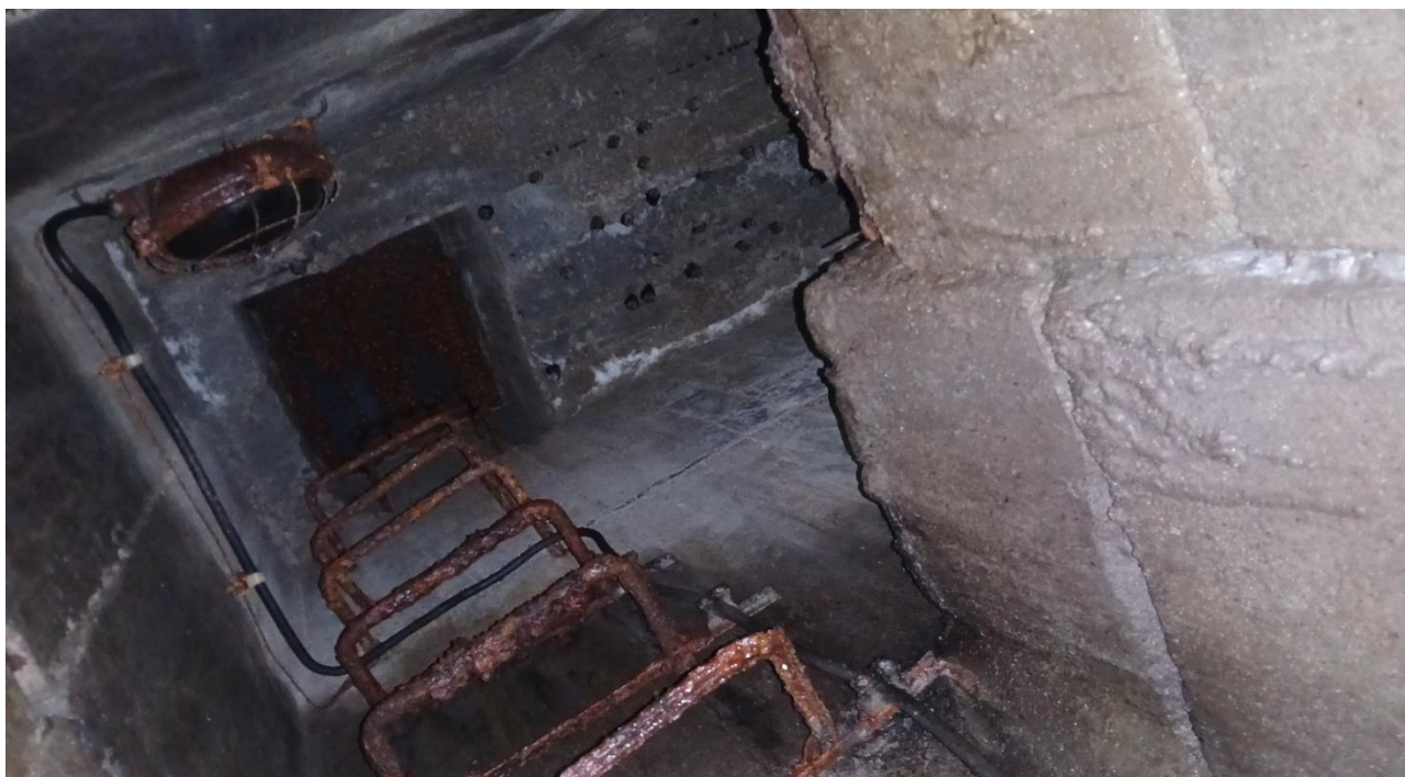
Obrázek 7: Vrch kontrolní šachty.